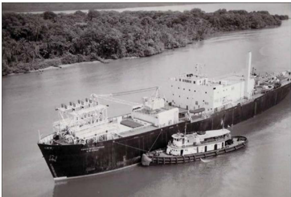
Рис. 2. Инфографика экспериментальной плавучей АЭС МН-А1 Sturgis (США) [11]

На рис. 2 показана инфографика АЭС МН-А1 Sturgis [11].