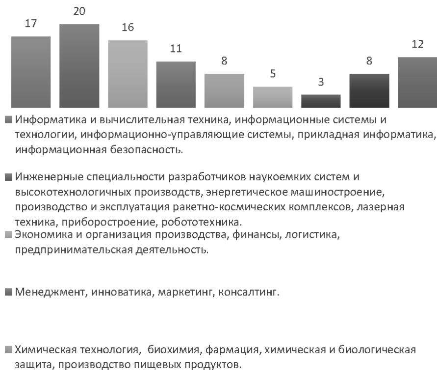
Рис. 1. Востребованные направления профессиональной деятельности выпускников (%) МОУ лицей г. Фрязино Московской области (2010–2014 гг.)

ляются академические институты ИСВЧПЭ РАН, ИРЭ РАН и несколько высших учебных заведений, почетное место среди которых занимает МГТУ им. Н.Э. Баумана. Поэтому в лицее проводится большая работа по взаимодействию с этим университетом и вовлечению старшеклассников в сферу инженерного творчества. В свою очередь МГТУ им. Н.Э. Баумана проводит активную профориентационную работу с учащимися третьей ступени обучения. В 2008 г. Президиум Российской академии образования присвоил МГТУ им. Н.Э. Баумана статус экспериментальной площадки при президиуме РАО по теме «Школа — вуз: преемственность научно-исследовательской и проектной деятельности». В 2012 г. МГТУ им. Н.Э. Баумана провел академическую аттестацию МОУ лицея и присвоил ему статус базового профильного учреждения МГТУ им. Н.Э. Баумана. Такая высокая оценка не только признает достижения лицея в качестве общеобразовательной инновационной организации с углубленной подготовкой учащихся по физико-математическому, информационно-технологическому и естественно-научному направлениям, но и заставляет повышать качество обучения во взаимодействии с вузом через «создание и использование потенциала этого взаимодействия» [7].